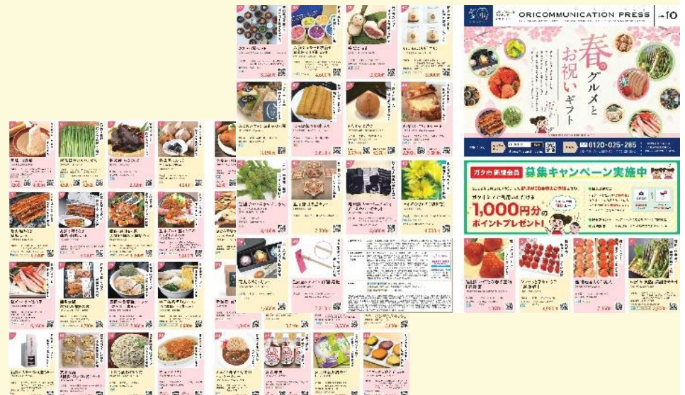
オリココミュニケーションプレスvol.10